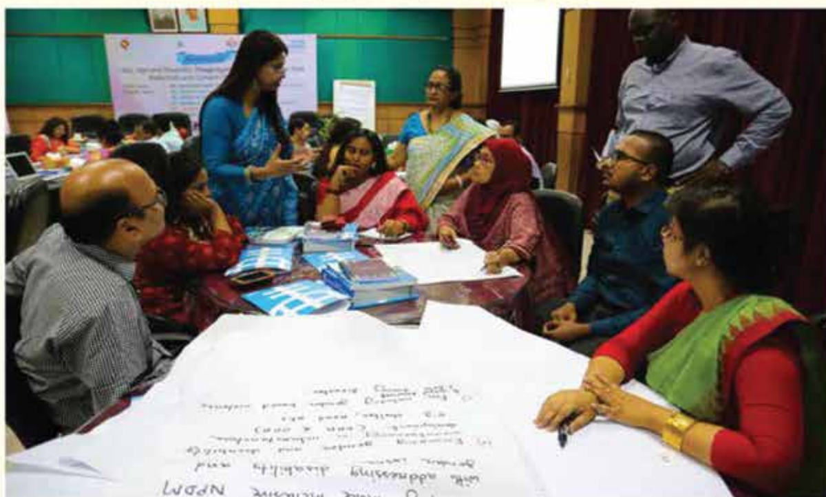
Caption: Interactive discussion during the group work session

The groups were presented with six questions and given an hour to work on them. The points mentioned by each group to answer the questions were then presented in front of the wider audience. The points highlighted by the various groups are mentioned below: