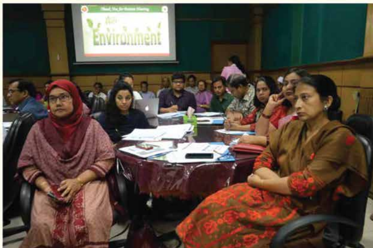
Caption: Participants watching the other group member's work.