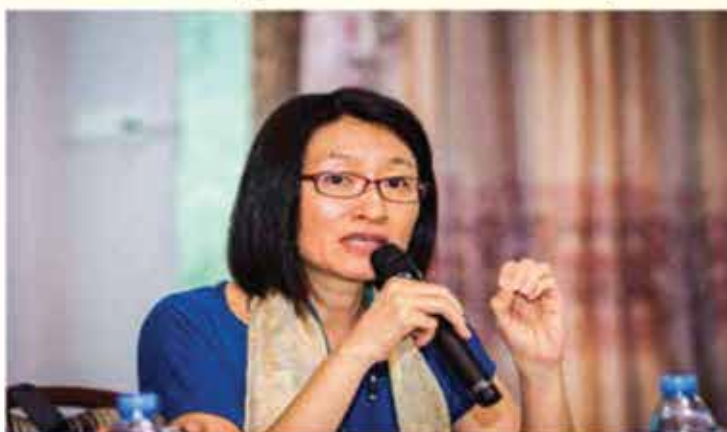
Picture: Speech of Ms. Shoko Ishikawa, Country Representative, UN Women Bangladesh

flood response experiences indicated that disaggregated climate and disaster statistics is not available. CEDAW recommendations also highlighted the lack of disaggregated data in local, regional and national level and, thus, emphasized on the institutionalization of disaggregated data collection through the national statistical system.